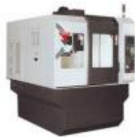
Schnelle Bearbeitungszentren mit oder ohne Palettenwechsler