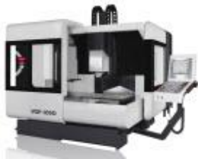
VZP700 Portalbearbeitungs- zentrum mit 3 Achsen