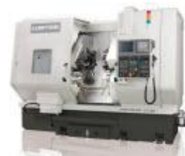
Drehmaschinen auch mit Gegenspindel und Y-Achse