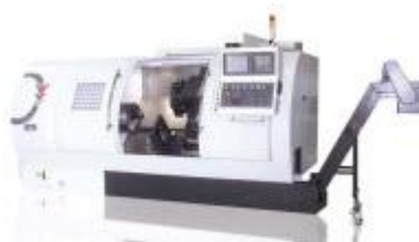
Große horizontale Drehmaschinen