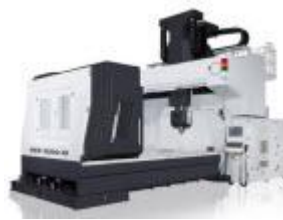
3- oder 5-Achsportal- oder Gantrymaschinen