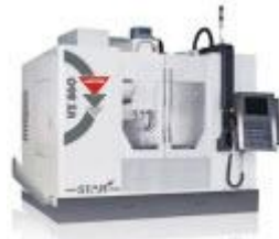
Stabile Fräsmaschinen mit oder ohne Palettenwechsler