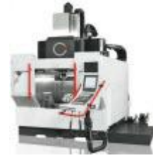
VZG80: 5-Achsenmaschine mit 600 Werkzeugen