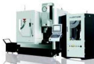
VZG65: 5-Achsenmaschine mit Palettenwechsler